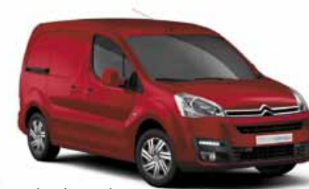
Pack Look Intégral