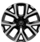
DVOBOJNE 19" ALU FELGE ART SA DIJAMANTNOM OBRADOM*