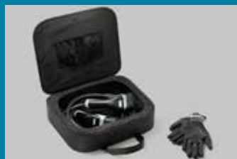
TORBA KABLA ZA PUNJENJE