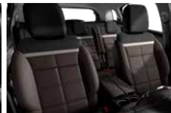
KOMBINACIJA UNUTRAŠNJOSTI HYPE BROWN