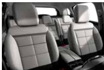
KOMBINACIJA UNUTRAŠNJOSTI METROPOLITAN BEIGE