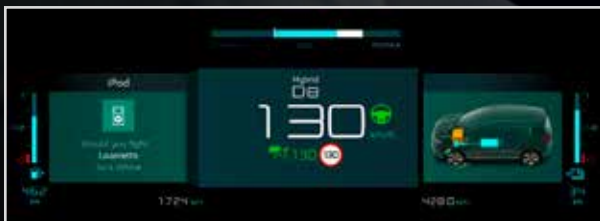
Osobni način: mogućnost osobnih podešavanja prikazanih informacija.