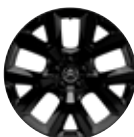
19" ALUMINIJSKE FELGE ART BLACK*