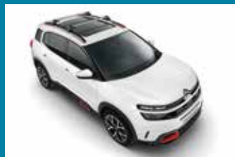
KROVNI PRTLJAŽNI NOSAČI