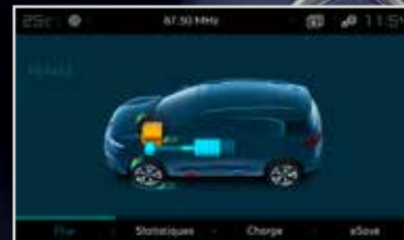
Protoci energije: uvid u djelovanje hibridne tehnologije.