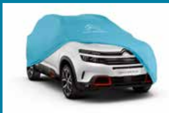
ZAŠTITNA NAVLAK ZA PARKIRANJE U UNUTRAŠNOSTI