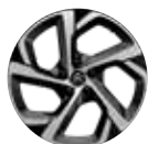
DVOBOJNE 18" ALU FELGE SWIRL SA DIJAMANTNOM OBRADOM