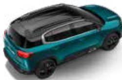
PLAVA TIJUCA (M)