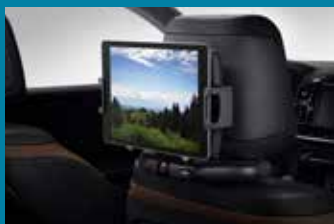
NOSAČ ZA MULTIMEDIJSKI UREĐAJ