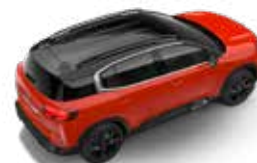
CRVENA VOLCANO (P)