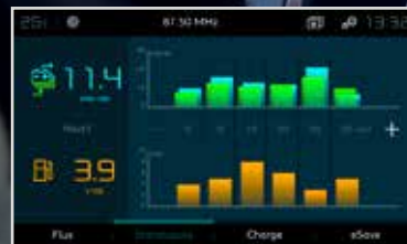
Statistički podaci: uvid u podatke o potrošnji električne energije i goriva za optimizaciju vožnje.