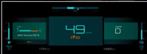
Način "mjeraci": prikaz informacija o vožnji u ELEKTRIČNOM/HIBRIDNOM/SPORTSKOM načinu.

Citroën SUV C5 Aircross Hybrid opremljen je 12,3-inčnim ekranom na dodir na kojem ćete uvijek imati dostupne informacije o hibridnoj tehnologiji i njenom djelovanju. Sadrži poseban prikazivač hibridnog načina na kojem možete pregledavati najvažnije informacije o vožnji s hibridnim pogonom, kao na primjer indikator snage ili raspoloživi domet. Na 8-inčnom ekranu prikazuju se i posebne informacije kao što su dijagram protoka energije, statistika o potrošnji, podešavanja vremenski odloženo punjenja baterije ili funkcija "e-save" kojom se može predvidjeti rezervna količina električne energije (10 km/20 km ili cjelokupni kapacitet baterije).