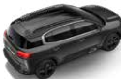
SIVA PLATINIUM (M)