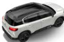
PERLA BIJELA (P)