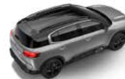
SIVA ACIER (M)