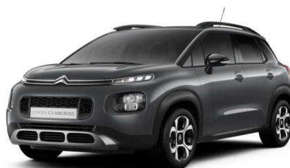
VLM0 Siva PLATINUM