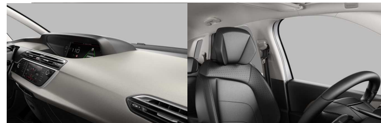
8PFC AMBIENT DUNE BEŽ koža