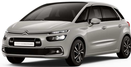
EUM0 Siva Sable