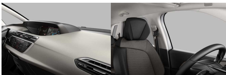
IXFC AMBIENT DUNE BEŽ tkanina