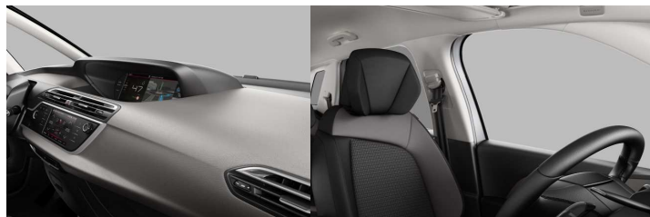
1HFR AMBIENT HYPE SIVA tkanina/koža