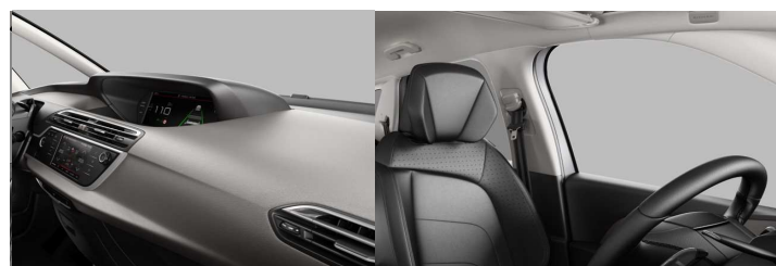
8PFR AMBIENT HYPE SIVA koža