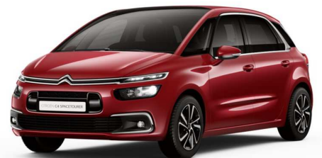
PYM0 Crvena Rubi