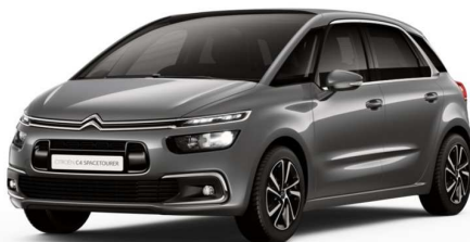
VLMO Siva Platinum