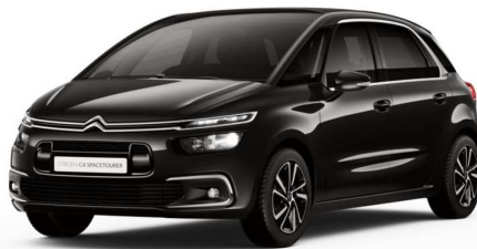
XYP0 Crna Onyx