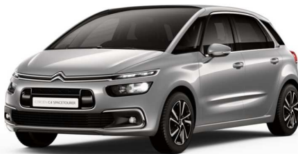
F4M0 Siva Artense