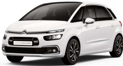
WPP0 Bjela Banquise

Predstavljene boje karoserija i presvlaka su informativne prirode, jer tehnike štampanja ne omogućavaju pouzdane reprodukcije boja.