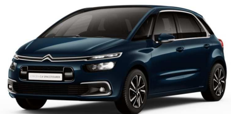
CNM0 Plava Alchemy