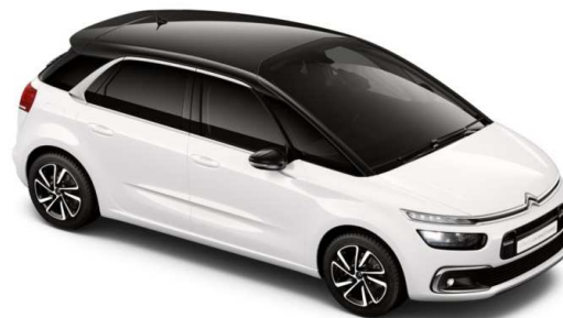
JD04 Krov u srni boji Noir Onyx