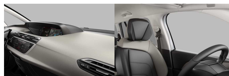
8QFC AMBIENT DUNE BEŽ nappa koža