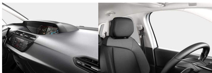
8LFT Obloge u tkanini Milazzo smeđa

Predstavljene boje karoserija i preslaka su informativne prirode, jer tehnike štampanja ne omogućavaju pouzdane reprodukcije boja.