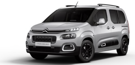
F4M0 Siva ARTENSE