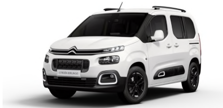
WPP0 Bijela BANQUISE

Predstavljene boje karoserija i presvlaka su informativne prirode, jer tehnike štampanja ne omogućavaju pouzdane reprodukcije boja.