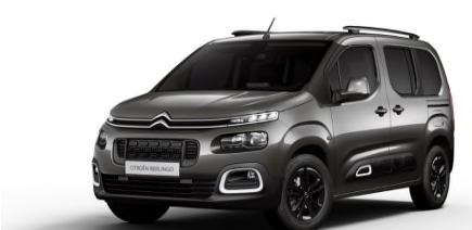
VLMO Siva PLATINUM