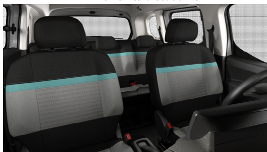
OFFT Unutrašnji ambijent METROPOLITAN GREY