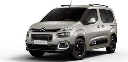
EUM0 Siva SABLE