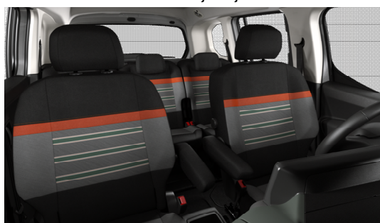
OGFR PAKET XTR