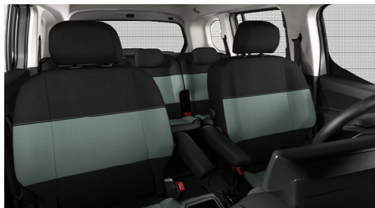
OEFQ Preslake od tkanine MICA GREEN