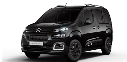
XYP0 Crna ONYX