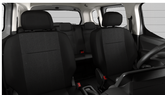
OAFY Unutrašnjost iz tkanine u sivi boji Mica

Predstavljene boje karoserija i preslake su informativne prirode, jer tehnike štampanja ne omogućavaju pouzdane reprodukcije boja.