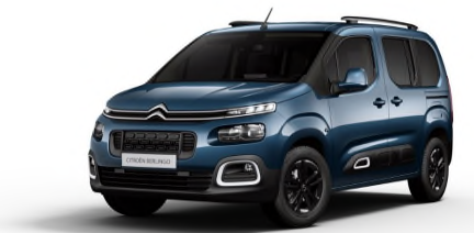
JGM0 Plava NUIT