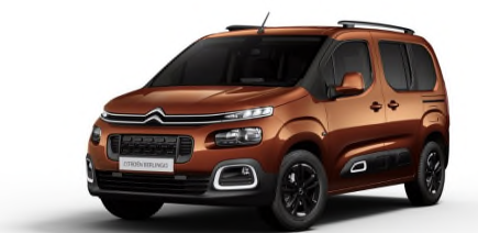
LGM0 Smeđa CUPRITE