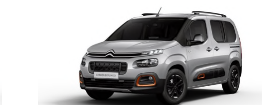
OGFR Paket XTR