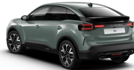
EME0 – Zelena Manhattan