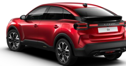
VHM5 – Crvena Elixir