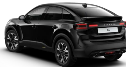
9VM0 – Crna Perla Nera