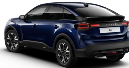
6LM0 – Plava Eclipse

N – obična boja, K – metalik boja P – posebna boja