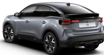
SXM0 – Siva Mercury