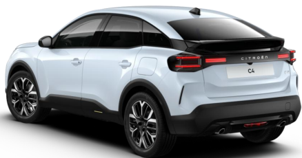
SUM0 – Bijela Okenite