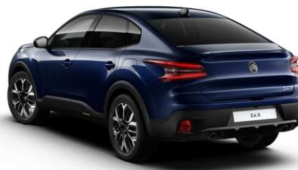
6LM0 – Plava Eclipse

N – obična boja, K – metalik boja P – posebna boja