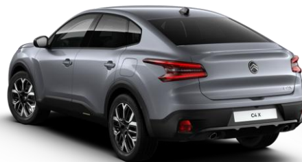
SXM0 – Siva Mercury