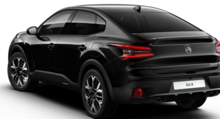
9VM0 – Crna Perla Nera