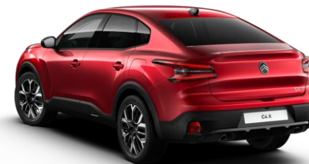
VHM5 – Crvena Elixir