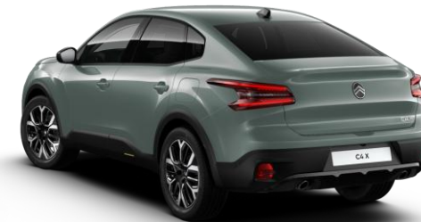
EME0 – Zelena Manhattan