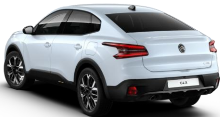
SUM0 – Bijela Okenite